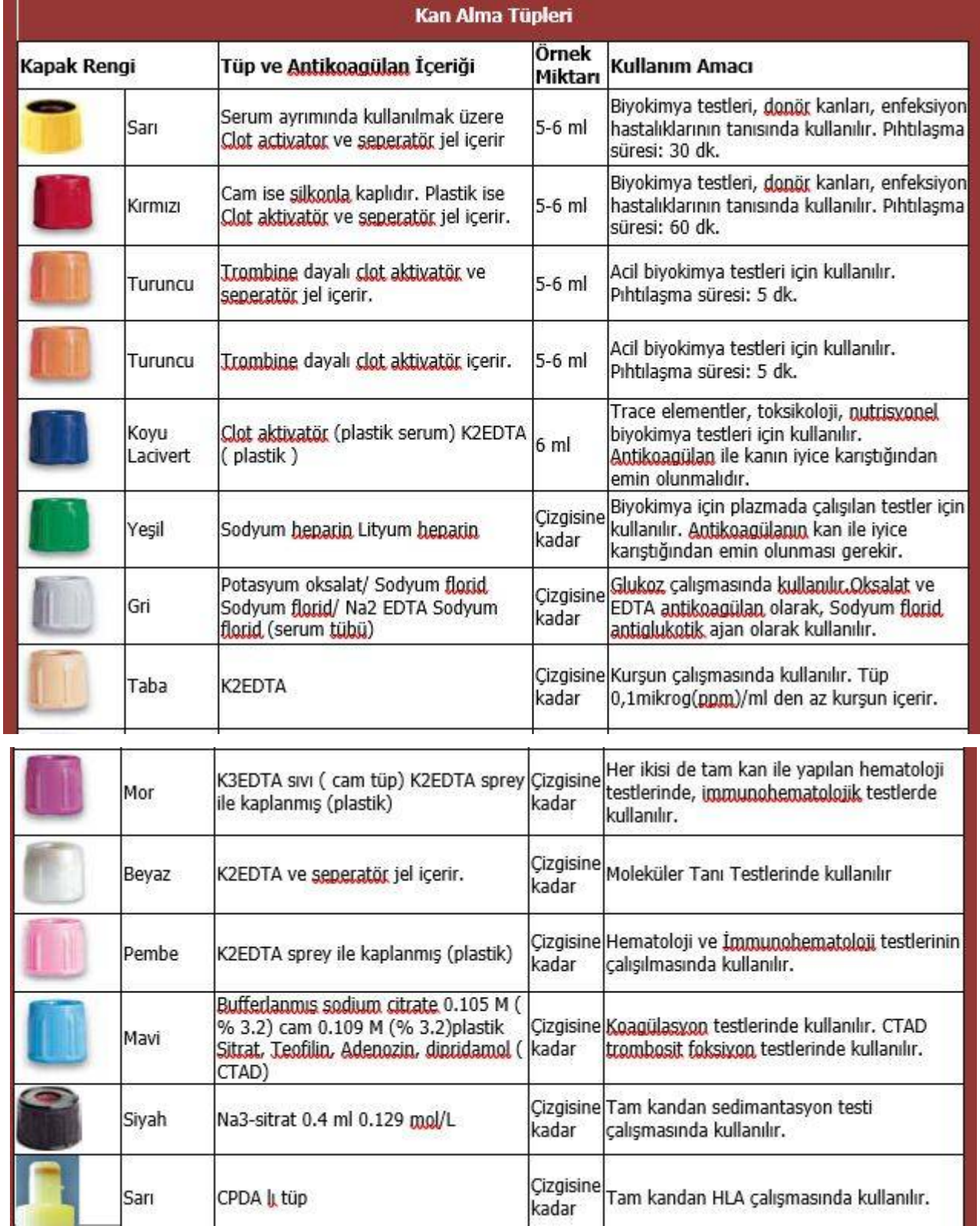
Tablo-1.Kan Alma Tüpleri